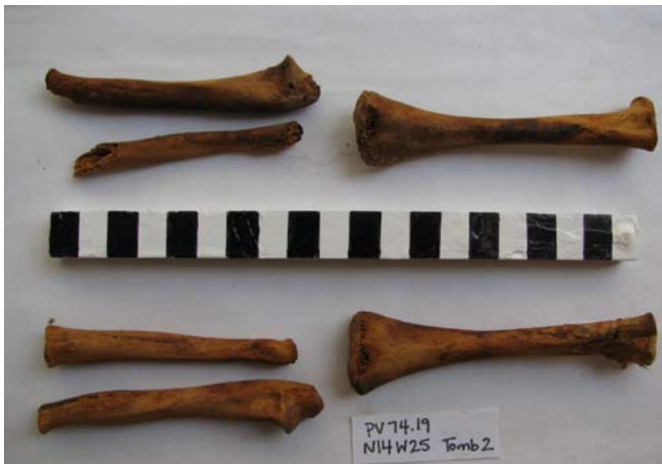
Figura 12. Huesos largos deformados del infante de la segunda olla ilustrada en la figura 10.