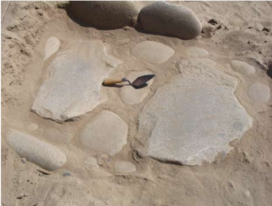
Figura 7. Olla (Tumba 1) descubierta en las inmediaciones de las lajas ilustradas en Figura 6.

cionada, se llegó a ubicar otra olla (Tumba 2) con las mismas características que el anterior (Figuras 3B y 10). La vasija estaba rajada y su abertura también sellada con una laja y argamasa. Al interior de la olla estaban los restos de otro infante, también envuelto en algodón y tejido. Junto al pequeño envoltorio que contenía los restos del infante se hallaron productos de maní ( Arachis hypogaea ) depositadas como ofrendas. A diferencia del infante anterior, el segundo infante no poseía una banda similar (Fig. 11), hecho que deja abierta la posibilidad que la banda decorada tal vez es símbolo de status social. La evaluación dental y del crecimiento de los huesos sugiere una edad aproximada de 18 meses ( \pm 6 meses). Importante es anotar, y a diferencia del infante anterior, este segundo infante presenta patologías. Por ejemplo, los huesos radio y cúbito, peroné y tibia están deformados (relativamente anchos), y este también es el caso de los huesos metatarsianos (Fig. 12). Los dientes incisivos también presentan defectos al parecer como resultado de la carencia de minerales.