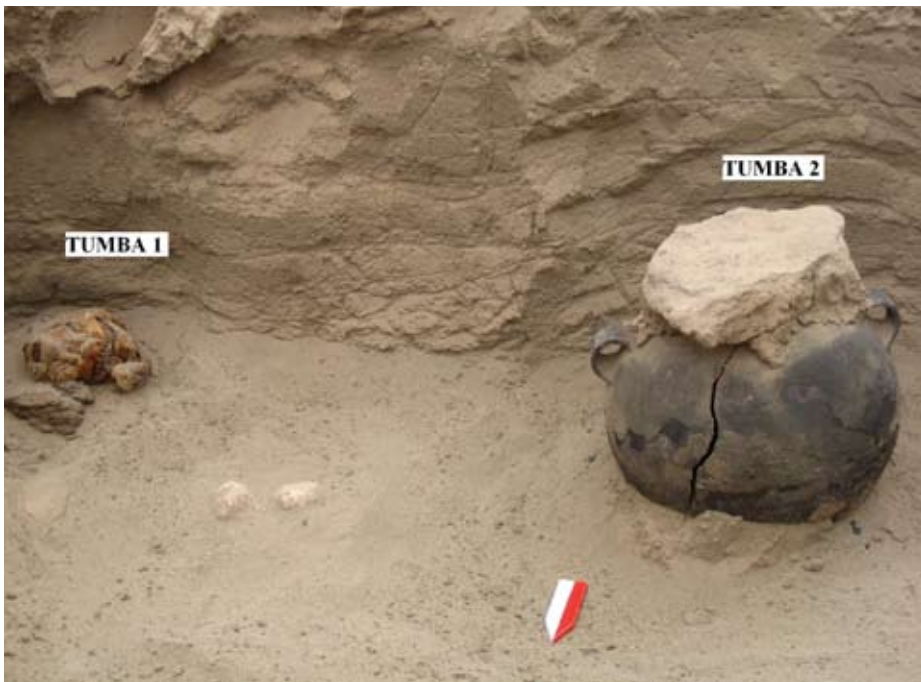
Figura 10. Olla (Tumba 2) ubicada al lado oeste de la olla ilustrada en la Figura 7.