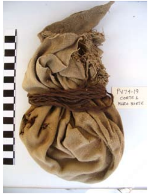
Figura 14. El tejido ilustrado en la Figura 12 una vez retirado la cuerda.