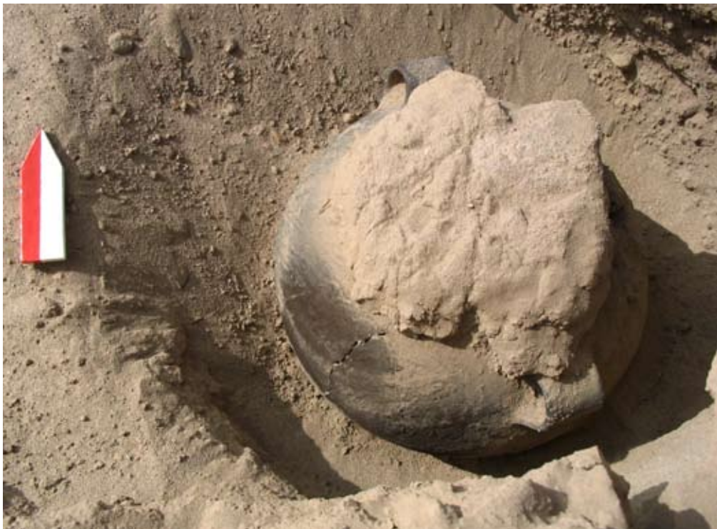
Figura 6. Lajas unidas con argamasa formando una forma de pavimento o cobertura.