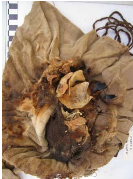
Figura 15. Cabeza fragmentada de un infante hallado al interior del tejido ilustrado en la Figura 13.