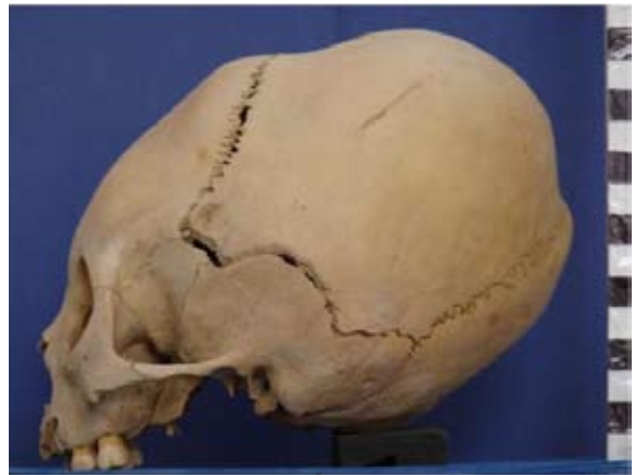
Figura 5. Vista lateral del cráneo del sub-adulto ilustrado en Figura 4