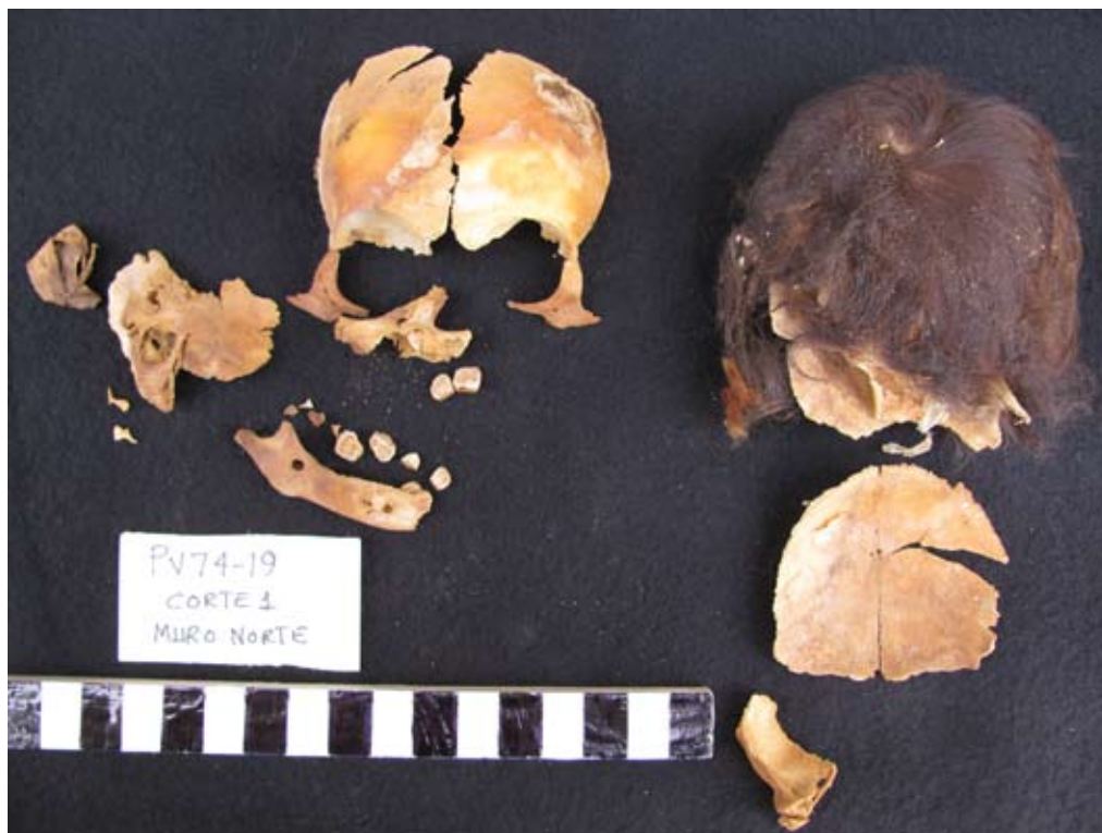
Figura 16. Los huesos fragmentados de la cabeza del infante ilustrado en las figuras 12, 13 y 14.

Amato siguen siendo invisibles en el registro arqueológico. Se hace oportuno agregar que en el sitio de Hacha perteneciente al periodo Inicial y ubicado en el valle de Acarí, durante las excavaciones efectuadas en 1986 se llegó a recuperar 3 cabezas humanas pero sin las características de las cabezas trofeo. Dicho hallazgo sugiere que la práctica de obtener cabezas humanas es relativamente antigua en el valle de Acarí.