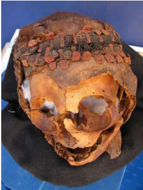
Figura 8. Cabeza de un infante de Tumba 1 ilustrada en Figura 7; observe que la cabeza lleva una banda decorada.