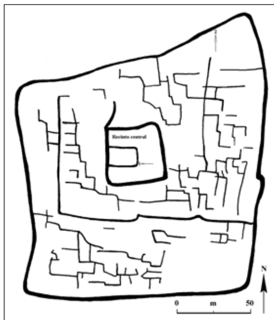
Figura 2. Sitio arqueológico de Amato con indicación del recinto rectangular; las flechas indican la ubicación de los hallazgos (Dibujo por L. Valdez)

1998). Dicho recinto encierra otra estructura más pequeña y de forma rectangular. Durante la inspección superficial de la estructura rectangular se llegó a ubicar en el lado interior del muro del lado este, fragmentos de antara y una pieza trabajada de Spondylus . La presencia de estos artefactos, de manera particular del Spondylus , sugirió la particularidad del recinto rectangular, considerándose que tales artefactos ocurren sólo en contextos especiales.