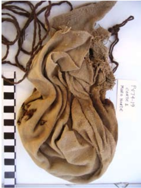
Figura 13. Tejido atado conteniendo la cabeza de un infante hallado en la esquina Nor-Este de Amato.