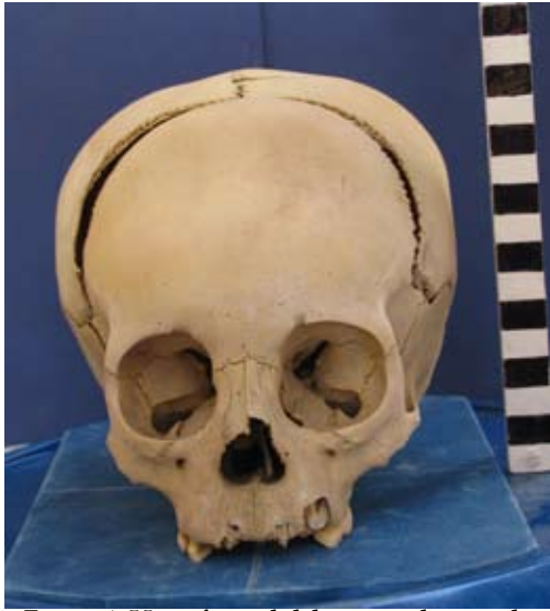
Figura 4. Vista frontal del cráneo de un sub-adulto ubicado en las afueras del recinto rectangular