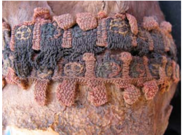
Figura 9. Detalle de la banda decorada asociada al infante cuya cabeza se ilustra en la Figura 8 (Foto L. Valdez).